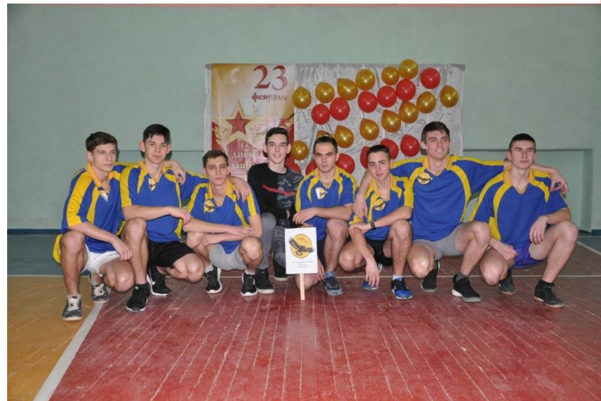
А ну-ка мальчишки!