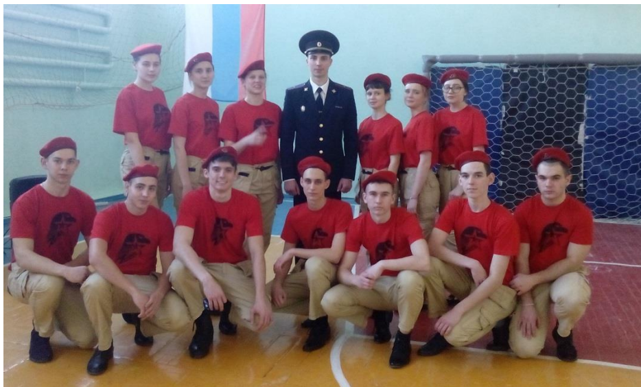
Смотр строя и песни